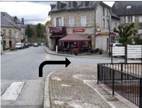
Arrivés à ce croisement à droite pour vous garer sur la place.