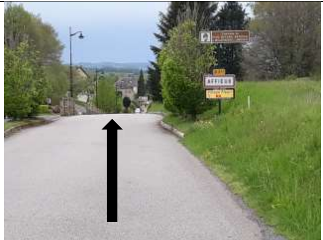
Tout droit direction Affieux