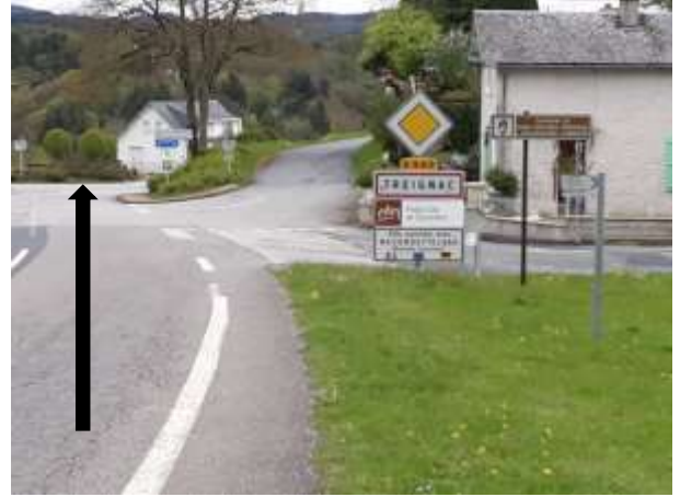
Arrivés à TREIGNAC, continuez tout droit