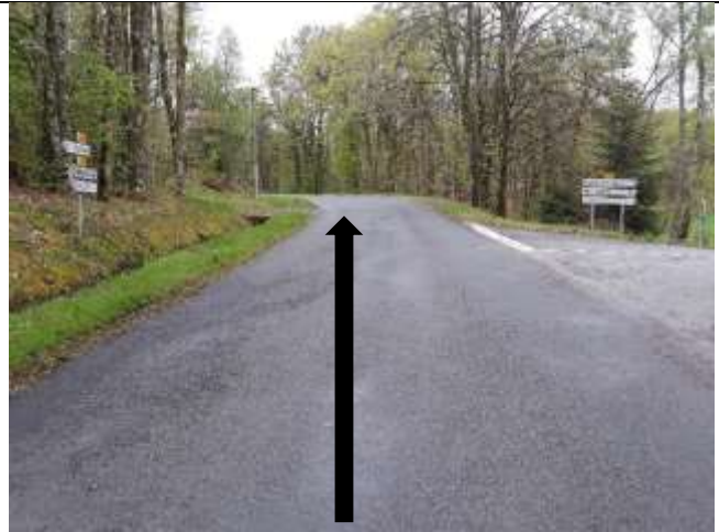
Tout droit direction Affieux