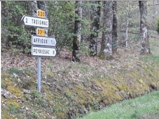
Tout droit direction Affieux