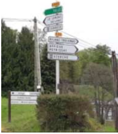
A la sortie de Treignac, prendre a droite direction Affieux