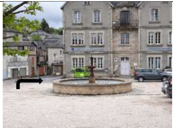
Exposition des véhicules sur cette place.

Repartez en direction de St Augustin via Affieux et Madranges