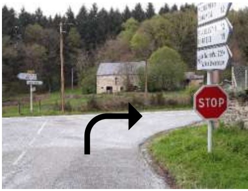
Au stop tournez a droite direction « TREIGNAC »