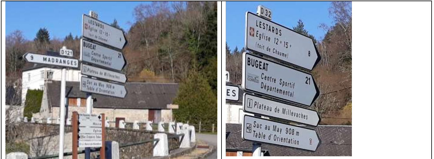
Au départ de Chaumeil, prendre en direction Lestards – Bugeat