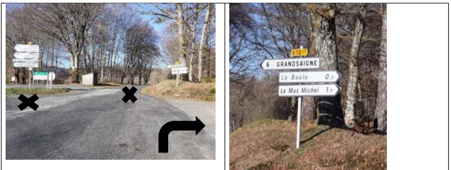
Au premier carrefour prenez en direction du MASMICHEL